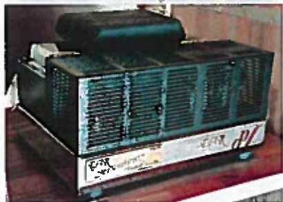
Jorma's anlæg består normalt af monoblokke fra EAR, direkte drevet af Bladeliuss' multiafspiller Gondul, som jo har indbygget volumenkontrol.

Det var ikke småting Jan og undertegnede udsatte anlægget for: Pop, rock, opera, jazz