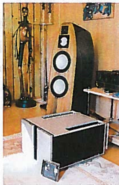
I dagens anledning havde Jorma også besøg af de enorme monotriner fra Vitus Audio. Besøget blev permanent.

mange togkilometer, for mange indtryk, for meget mad (m.m.) - vi kunne bare ikke mere, men måtte trække os tilbage til vores residens i den anden ende af grunden. De gæve svenskere fortsatte dog en time eller to mere.