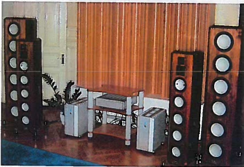
Et samlet overblik over højttaleropstillingen som kræver et pænt stort rum. I midten det aktive filter fra Bladelius, som sørger for frekvensdelingen til de to basårne såvel som en let equalisering.

Coltrane Supreme bygger, som navnet antyder, på erfaringerne fra Marten Coltrane (test i HF 8/03). Her er der dog tale om et langt større 5-vejs system med ikke mindre end 13 enheder pr. side! To helt separate