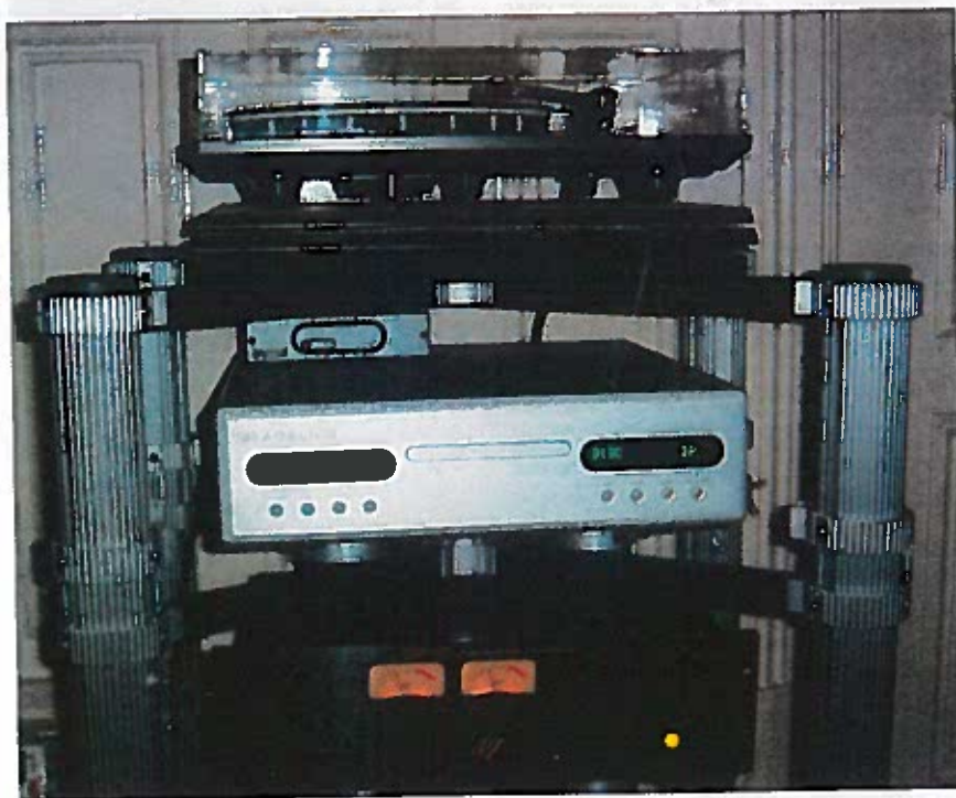
Signalkilderne. Øverst Rega pladespilleren med RB 700 arm og Benz pick-up. Herunder Bladelius Gondul CD/SACD afspilleren og nederst EAR forforstærker og RIAA-del.

optagelse og de udøvende end til højttalerne og det øvrige anlæg. En ting der dog hurtigt stod klart var at der var tale om noget af det bedste - hvis ikke det bedste - undertegnede og Johnny Sørensen har oplevet. Top og bund var helt exceptionel og i en klasse for sig selv. De seks basenheder med aktiv korrektion magtede at pumpe gevaldige lydtryk ud i det store lokale. Vel at mærke uden at det på nogen måde lød an-