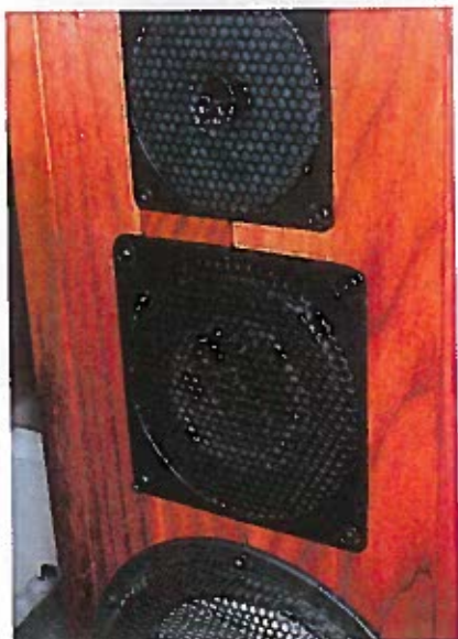
To medvirkende grunde til den meget høje pris og kvalitet. Nemlig de to diamantenheder, der dækker området fra 1.200 Hz og op til 100.000 Hz.

bastårne klarer via aktiv deling og digital defilter/rumtilpasning området fra ca. 15 Hz og op til 100 Hz. Hvert af de store sub-basser indeholder seks 8" keramiske Thiel enheder. Der vel at mærke tale om helt nyudviklede enheder med kraftige neodymium magneter og underhængte svingspoler. Faktisk er det første gang disse basser har fundet vej til et kommercielt højttalersystem. Kabinetterne er naturligvis bygget op efter alle kunstens regler med flerlags laminat og dæmpelim samt kraftig intern afstivning. Yderst er der den sorte kulfiberskal, som vi kender den fra Coltrane.