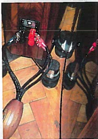
Bagfra ser man hvordan den bi-wirede hovedhøjttaler spejler sig i den blanke overflade på den langt større bashøjttaler.

ket gør det langt nemmere at designe et godt filter. Fra 1.200 Hz og op anvendes noget helt exceptionelt, ja faktisk er det verdens første højttalersystem, som gør anvendelse af Thiel & Partners 2" diamant mellemtone. Alene én af disse enheder, koster et pænt stykke over 100.000 kroner og dermed mere end mange investerer i hele deres anlæg. Fra omkring 8.000 Hz holder vi os til diamanterne, nemlig den samme 3/4" Thiel diskant som anvendes i Coltrane.