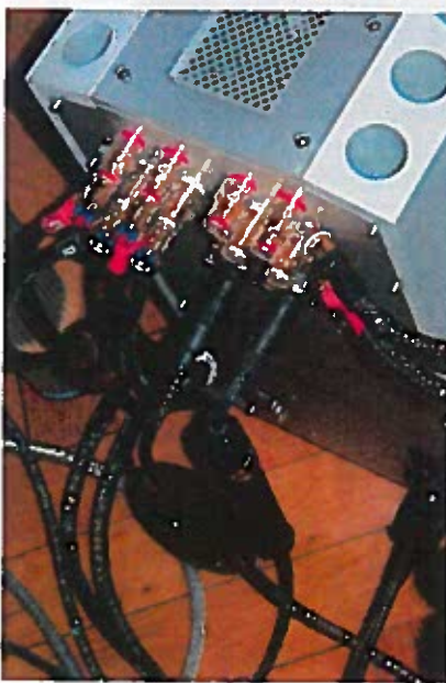
På bagsiden af Beowulf forstærkeren gemmer sig et mylder af Jorma kabler. Her finder man det nye Power såvel som Jorma No. 1 og det nye Prime med den karakteristiske trækklods.