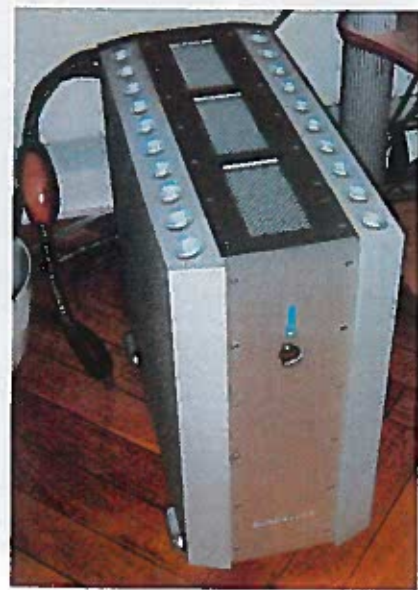
Bladelius Beowulf kunne ligne en monoforstærker men der er faktisk tale om to stk. 400 watt forstærkere i samme kabinet. Den ene med bi-polare transistorer til bassen og den anden med MOS-FETs til det øvrige område.